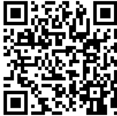
QR-Code Meine Umwelt-App

Weitere Informationen zur Asiatischen Hornisse und wie sich die Art von heimischen Insekten unterscheiden lässt finden sich auf der Homepage der LUBW https://www.lubw.baden-wuerttemberg.de/natur-und-landschaft/asiatische-hornisse sowie auf der Homepage der Landesanstalt für Bienenkunde der Universität Hohenheim unter https://bienenkunde.uni-hohenheim.de/vespavelutina . Dort finden sich auch weitere Informationen, wie Bürgerinnen und Bürger aktiv bei der Suche nach Tieren und Nestern mitwirken können. Seit April 2024 koordiniert die Landesanstalt für Bienenkunde in Stuttgart-Hohenheim im Auftrag der Naturschutzverwaltung das landesweite Management der Asiatischen Hornisse (Kontakt siehe Homepage).